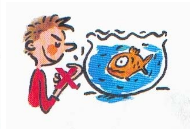
Ne frappe pas sur l'aquarium.