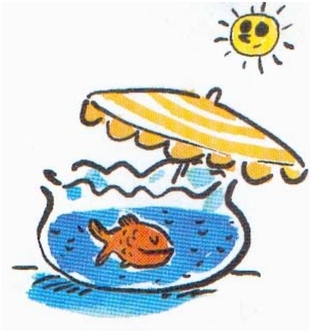
Ne place pas l'aquarium au soleil.