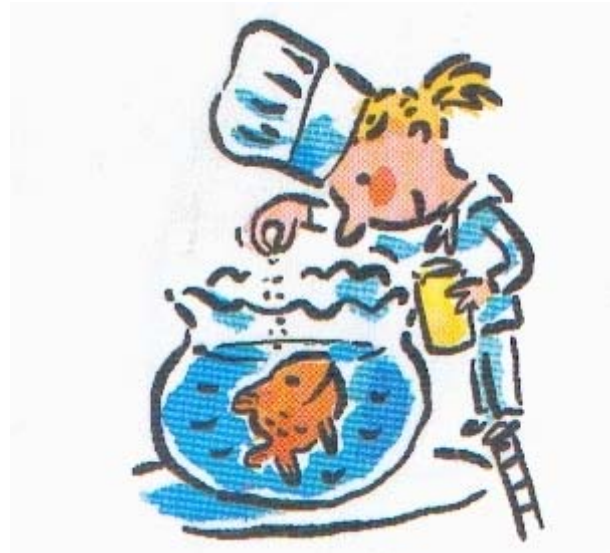
Donne-lui une pincée de nourriture par jour.