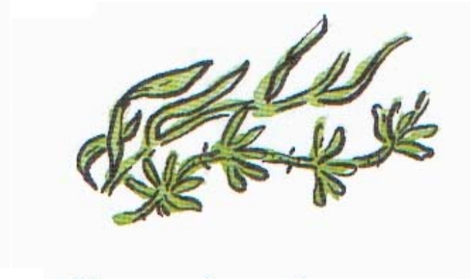
Place quelques algues.