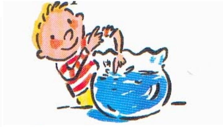
Mets de l'eau à température ambiante.